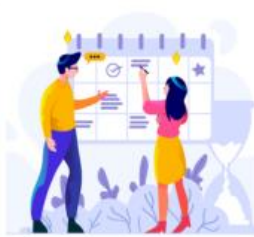
HORARIOS, VACACIONES Y TELETRABAJO