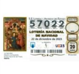
LOTERIA DE NAVIDAD