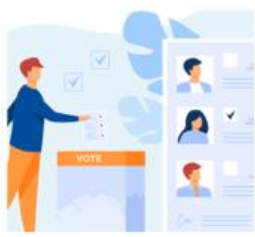
ELECCIONES SINDICALES ORANGE