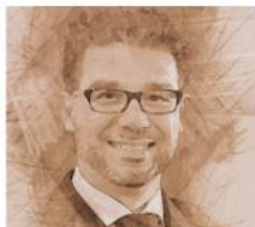
CAMBIO DE CEO