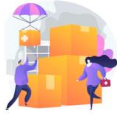
AYUDAS SOCIALES 2023