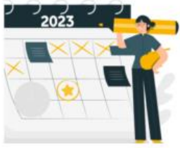
CALENDARIO LABORAL 2023