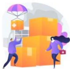
AYUDAS SOCIALES 2023