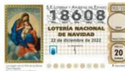
LOTERIA DE NAVIDAD