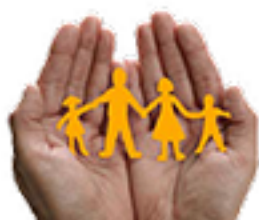
AYUDAS SOCIALES 2022