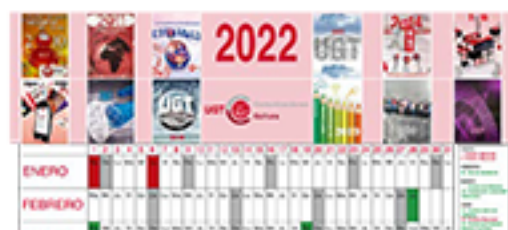
CALENDARIO LABORAL 2022