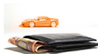
AHORRO EN RENTING